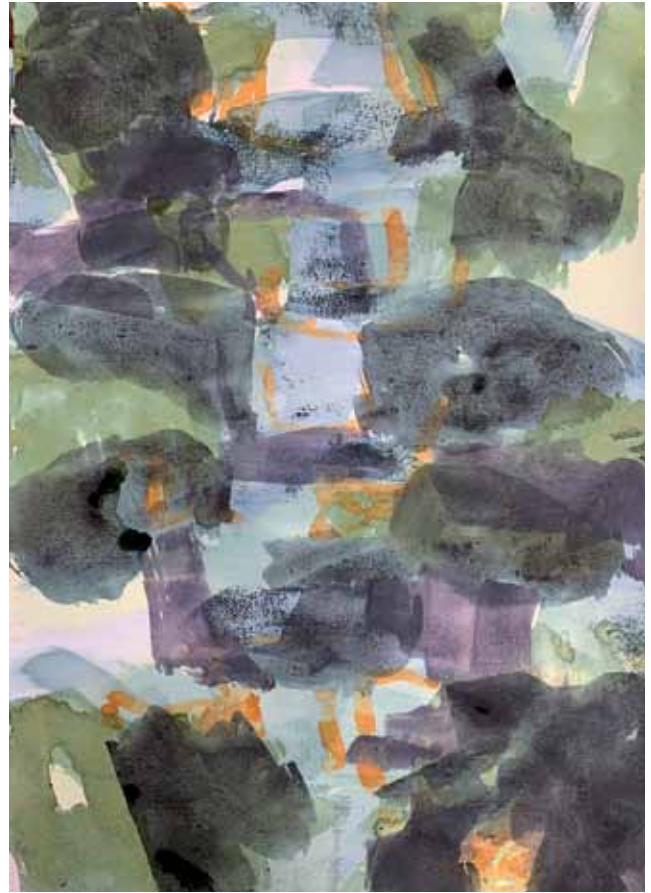
Gewächs 2, Mischtechnik auf Bütten, 57 x 77 cm, 1/2021