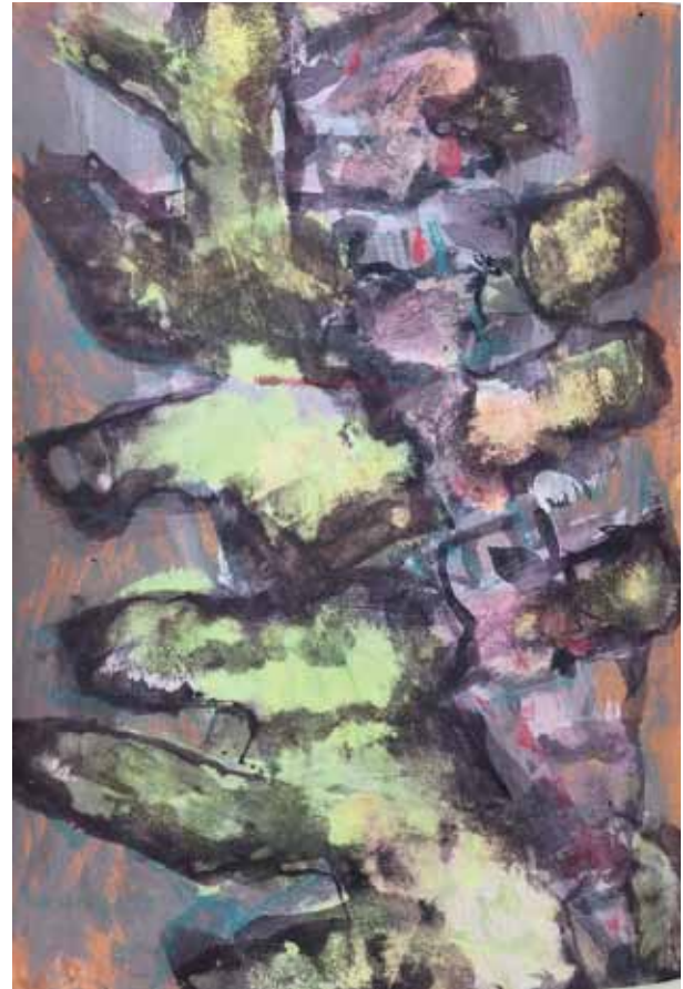
Links: W 6 Mischtechnik auf Leinwand 30 x 40, 12/2020