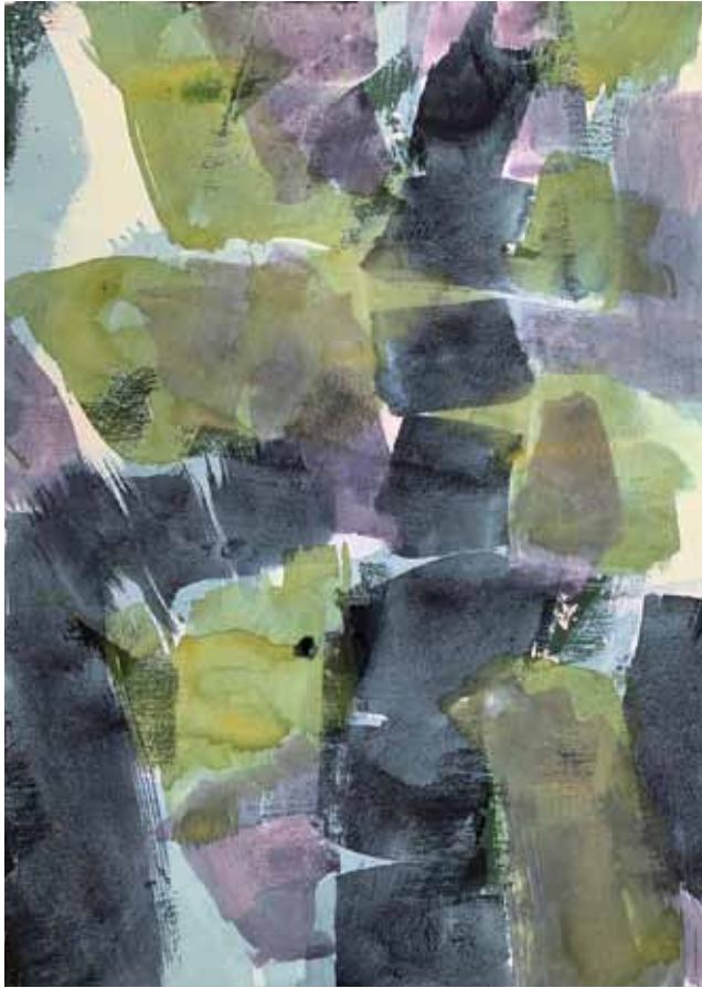
Gewächs 3, Mischtechnik auf Bütten, 57 x 77 cm, 1/2021