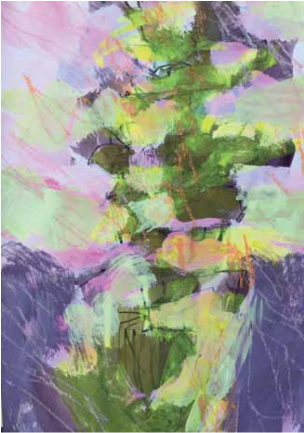
W 2 A3 Kreide, Acryl auf Papier 3/2020