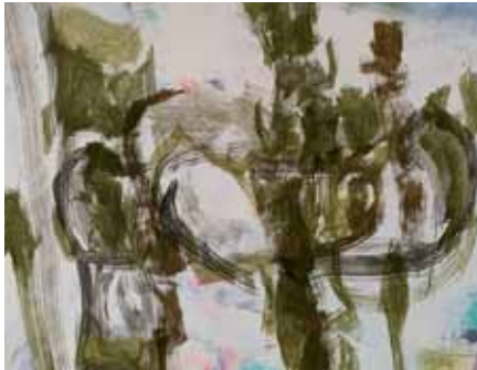
Entwicklungsstufen Gewächse 2021 Acryl auf Leinwand, 1.40 x 1.80 m