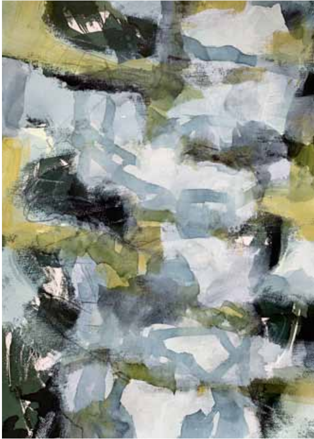
Gewächs 1, Mischtechnik auf Bütten, 57 x 77 cm, 12/2020