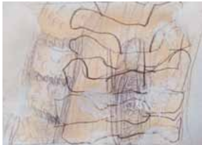
Skizze Wirbelkörper 2021