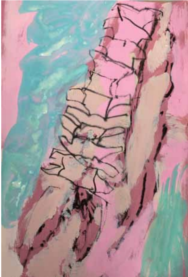
W 1 A4 Kreide, Acryl auf Papier 3/2020