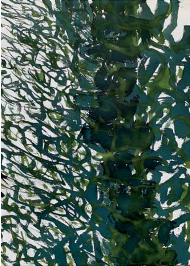
Gewächs grün, Beize auf Büthen, 57 x 77 cm, 12/2020