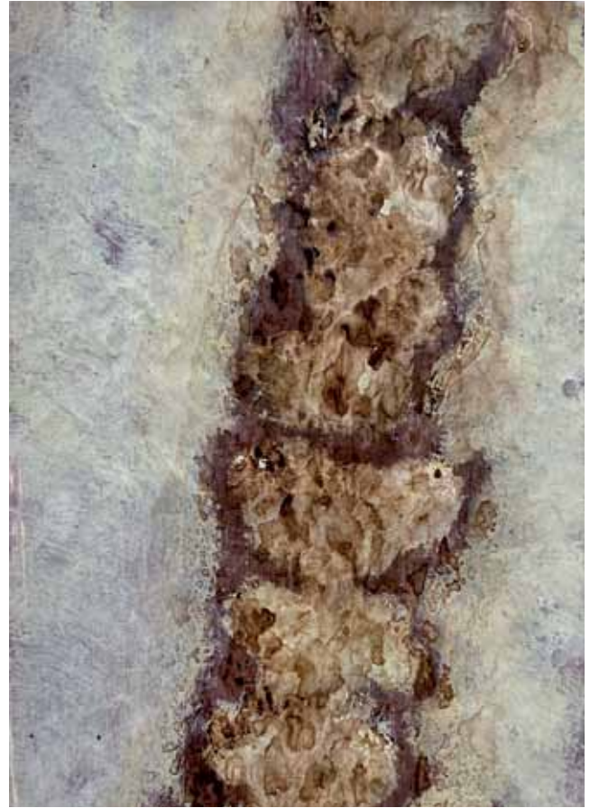
W 8 A4 Verwachsung, Mischtechnik auf Papier 1/2021