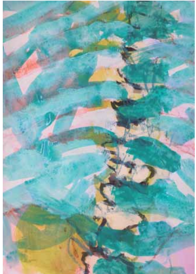
W 5 A3 Kreide, Acryl auf Papier 3/2020