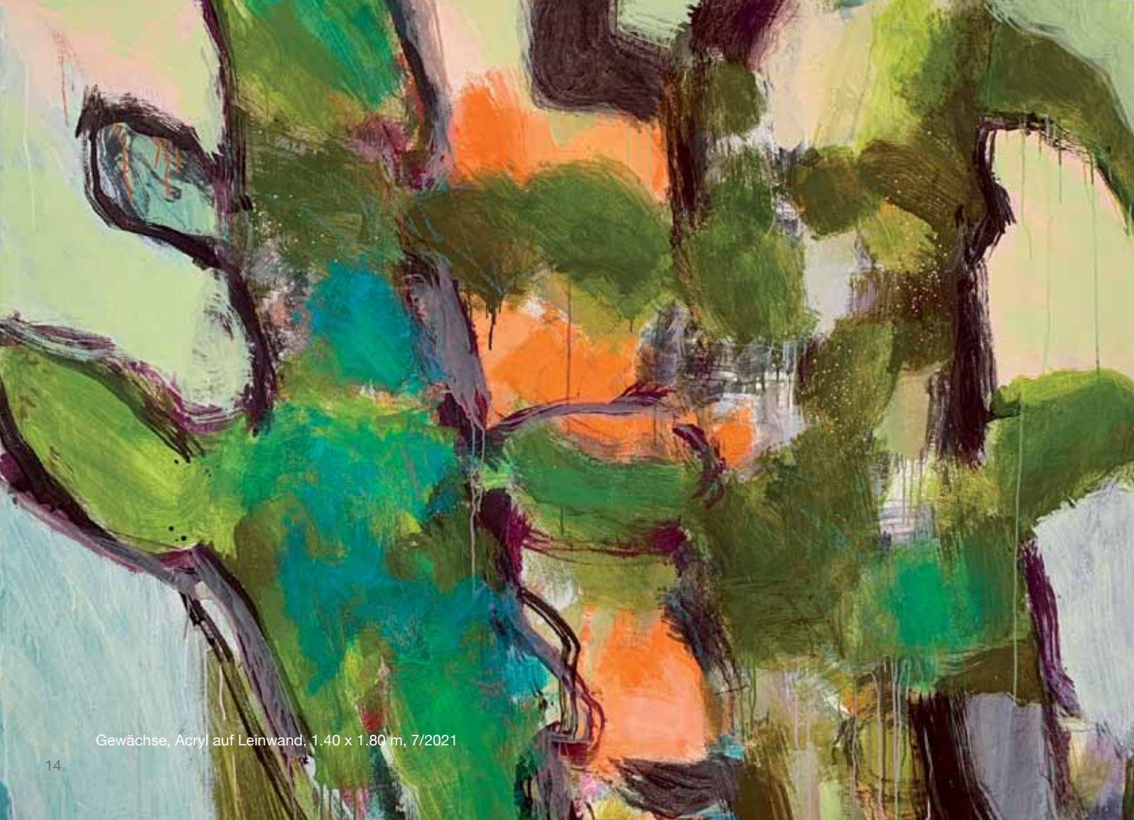
Gewächse, Acryl auf Leinwand, 1.40 x 1.80 m, 7/2021