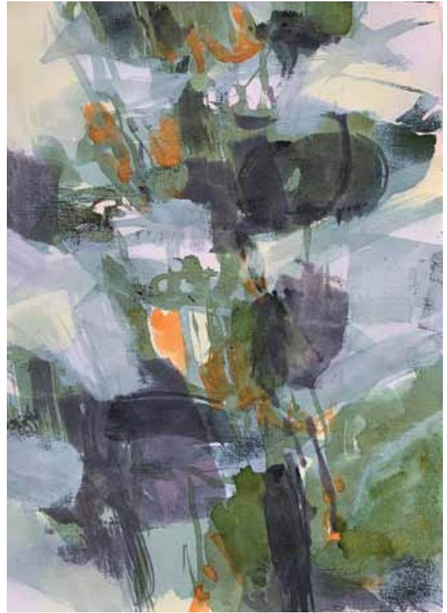
Gewächs 4, Mischtechnik auf Bütten, 57 x 77 cm, 1/2021