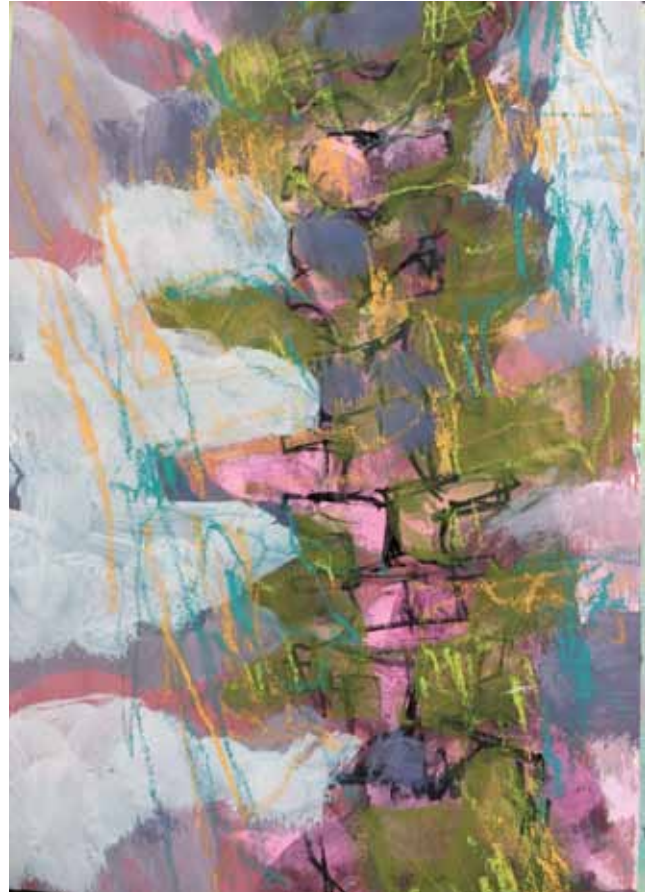
W 3 A3 Kreide, Acryl auf Papier 3/2020