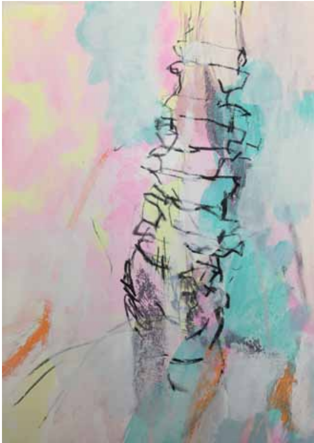
W 4 A3 Kreide, Acryl auf Papier 3/2020